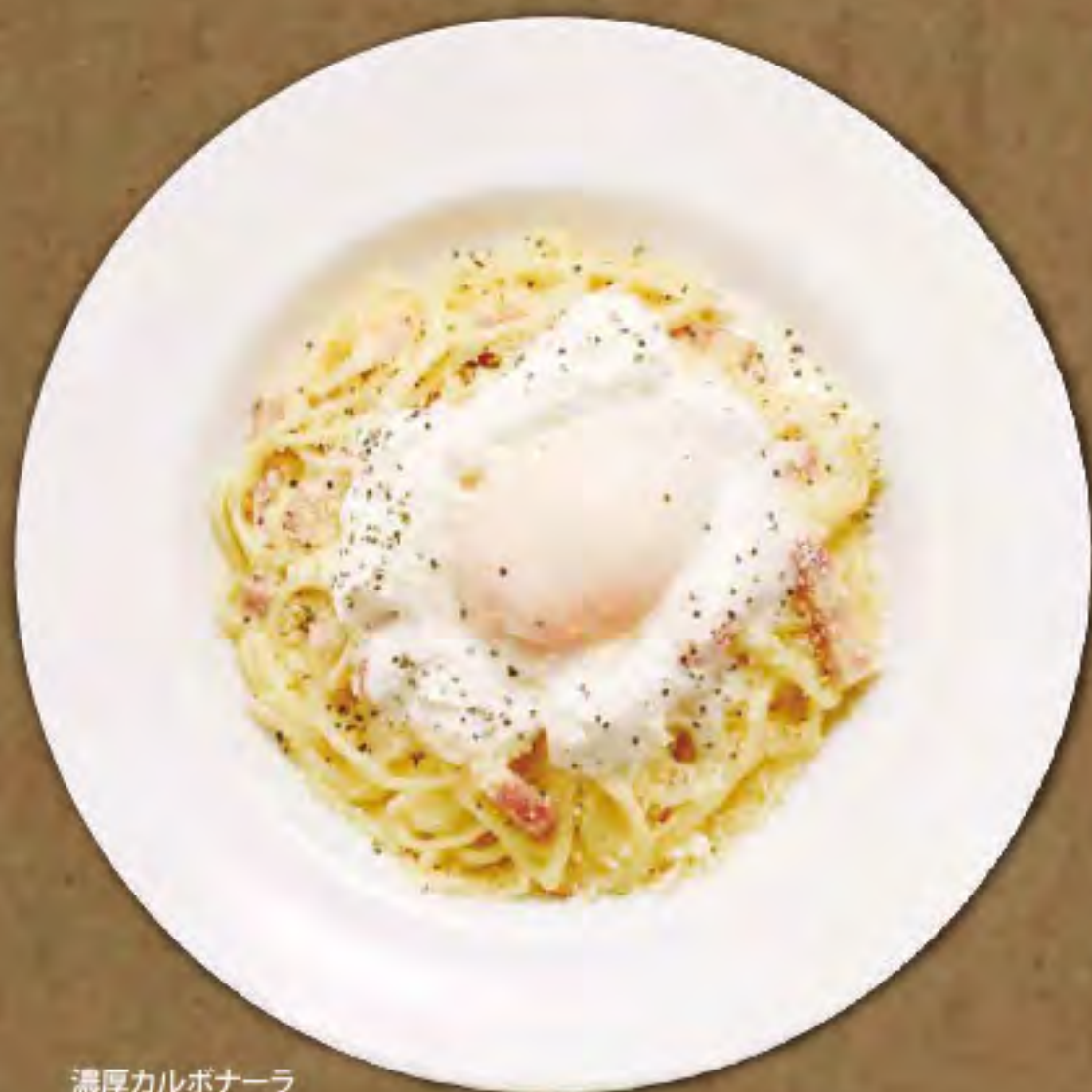
濃厚カルボナーラ