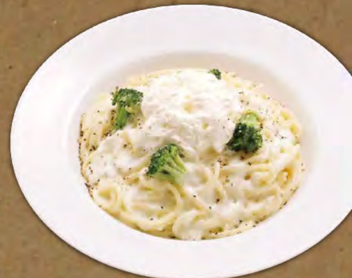
3種チーズの カプチーノクリーム仕立て