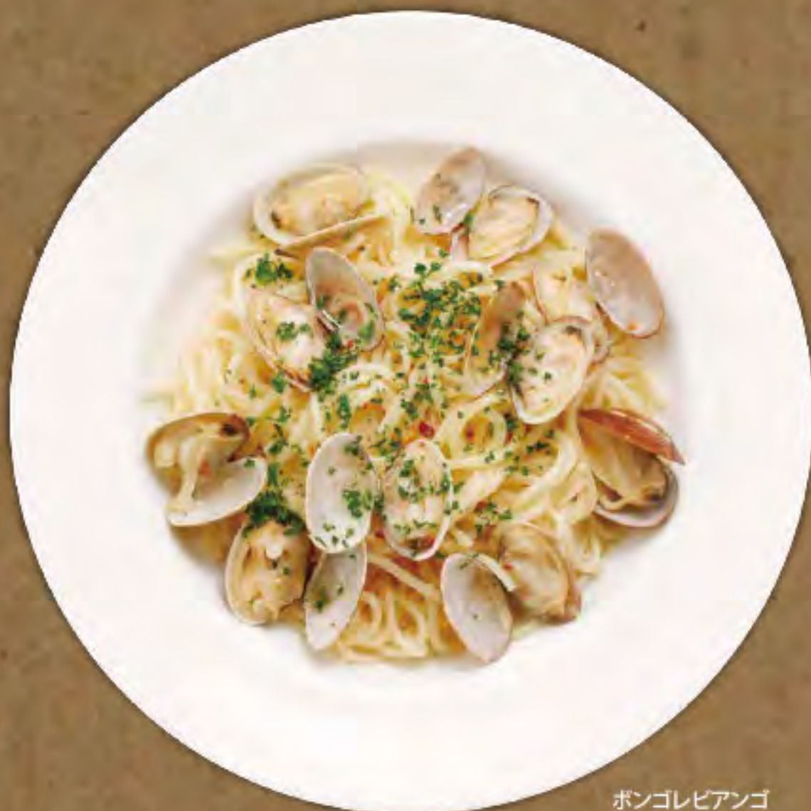
ボンゴレビアンコ